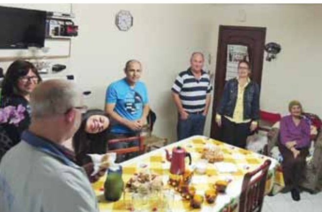
Eine gemütliche Atmosphäre und Essen gehören in der Bibelstunde dazu.